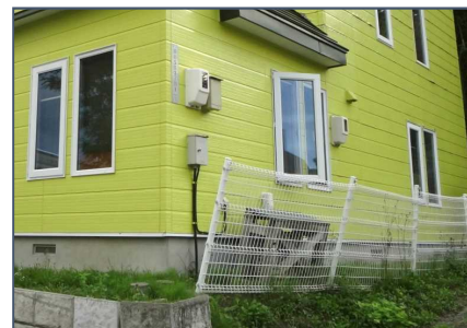
屋根の雪が当たり柵が破損