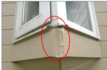
落雪による窓枠の破損