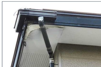
雪害による軒天損傷