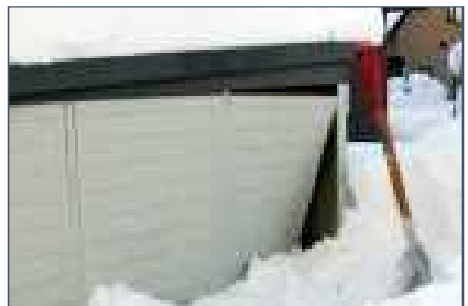
積雪荷重で物置が破損