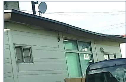
積雪による屋根の歪み