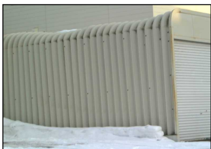
落雪で車庫の天井が歪んでしまった