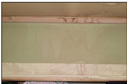
スノーダクトの詰まりによる室内の漏水