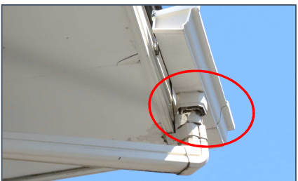
雪害で雨樋の損傷

こんな場合は火災保険が適用になる場合があります。 火災保険には加入されていますか？ まだでしたら、加入された方が良いです！ 当社より紹介できます。