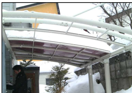
雪の重みでカーポートの天井が破損